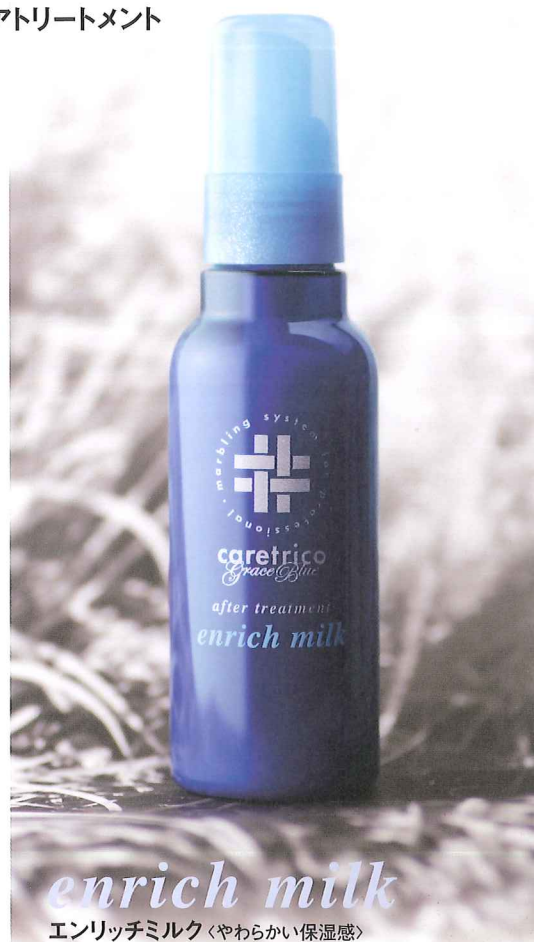
enrich milk エンリッチミルク〈やわらかい保湿感〉

1日中ふんわりとまとまる髪が持続。 髪にうるおいを与える美容液として、 スタイリングのベース作りに使用します。