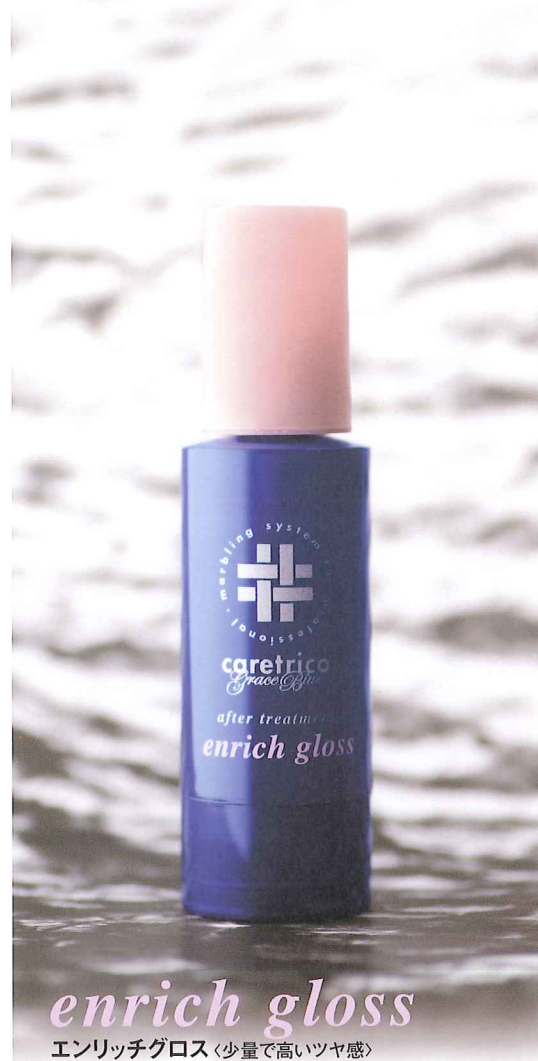
enrich gloss エンリッチグロス〈少量で高いツヤ感〉

1日中みずみずしいツヤのある髪が持続。 スタイリングの仕上げに、 ツヤの欲しい部分に少量使用します。