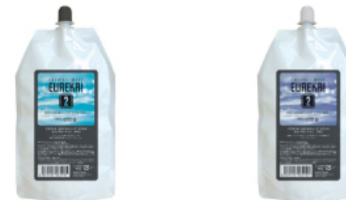
カクテルウェーブ エウレカ セカンドローション オキシC/T