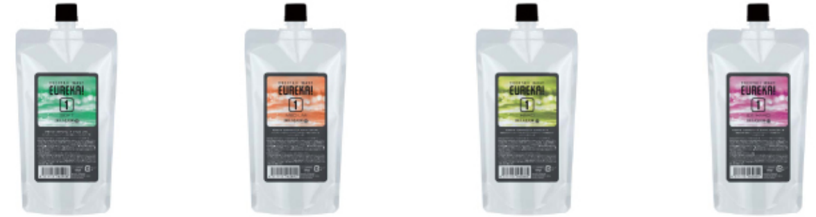
カクテルウェーブ エウレカ ソフト