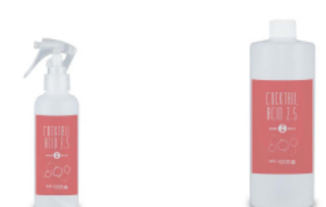
カクテルアシッド 2.5

pH2.5の2層構造でサロンワークやホームケアでも簡単に輝き・潤い・弾力が実感できるマルチケアトリートメント