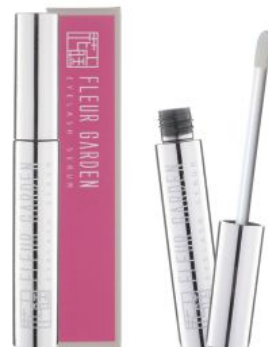
フルールガーデン アイラッシュセラム <まつ毛美容液> 5ml

フルールガーデン アイラッシュセラムをさっとひと塗りするだけで、明るく健康的で若々しい目元へと導きます。