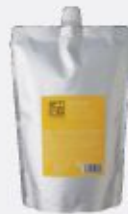
グレープフルーツ