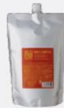
ジンジャーレモン