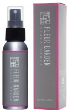
フルールガーデン スカルプセラム <頭皮用美容液> 76ml