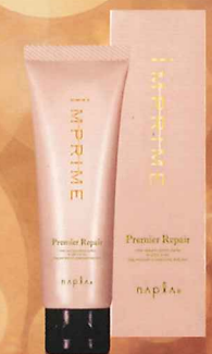
インプライム プレミアリベア リッチマスク NET.80g