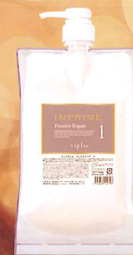
インプライム プレミアリベア 1 NET.1000g