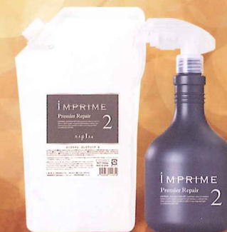
インプライム プレミアリベア 2 NET.500mL インプライム プレミアリベア 2 専用カートリッジ