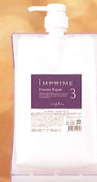
インプライム プレミアリベア 3 NET.1000g