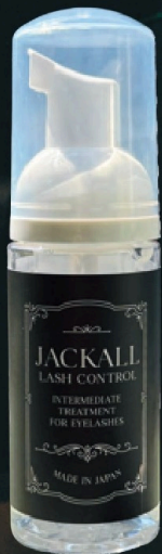
ジャッカル ラッシュコントロール50mL 【ラッシュリフト中間処理剤】