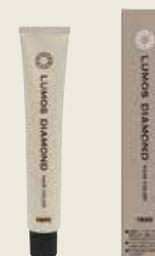
ルーモス ダイヤヘアカラー 1剤 80g