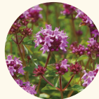
ワイルドタイム エキス 【保湿成分】