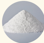
パンテノール 【整肌成分】