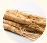
オタネニンジン根 エキス 【整肌成分】