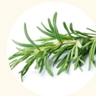
ローズマリー葉 エキス 【整肌成分】