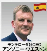
モンテローダ社CEO アンソニー・ウエストン

『METASLENDIA』は、スペインのモンテローダ社が開発した特許取得原料「metabolaid®」を1回あたり500mg配合*。食後のメカニズムに着目し、複数のヒト臨床試験で検証されてきた植物由来成分です。無理な食事制限に頼らず、毎日の栄養補給を内側からサポートします。