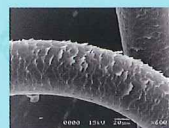
紫外線によるダメージ毛

紫外線によって起きるキューティクル表面のダメージをしっかりとケアします。天然由来成分であるゼインが髪全体に広がり、キューティクルの浮き上がりを抑えます。 ※トリートメントに配合