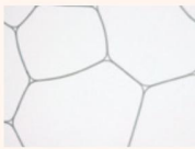
顕微鏡写真 Microscope photograph

Just as a cosmetic lotion attaches to the skin, the fine-grained and well-fitted bubbles penetrate into the hair, adding moisture while repairing hair damage to make hair which feels good to touch.