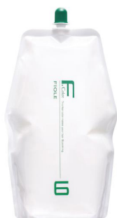
フィヨレ BLカラー OX6 第2剤 染毛補助剤 1,000mL / 2,000mL 業務用 / 医薬部外品