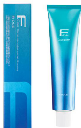
フィヨレ Pカラー クオルシア 第1剤 染毛剤 120g 業務用 / 医薬部外品