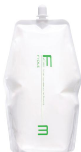
フィヨレ BLカラー OX3 第2剤 染毛補助剤 1,000mL / 2,000mL 業務用 / 医薬部外品