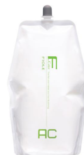
フィヨレ BLカラー AC3 (アルカリキャンセル) 第2剤 染毛補助剤 1,000mL / 2,000mL 業務用 / 医薬部外品