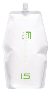
フィヨレ BLカラー OX1.5 第2剤 染毛補助剤 2,000mL 業務用 / 医薬部外品