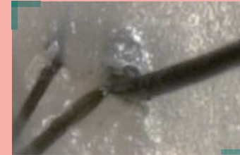
脂がたまった状態