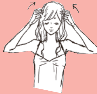
② 簡単なマッサージ方法

頭皮の太い血管5本に併せて塗布をします。1ラインに3プッシュずつ塗布していきます。