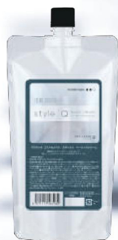
デラクシオ コスメカクテル スタイルQ ベーシッククリーム

ライトダメージ毛からミドルダメージ毛に対して幅広く対応できる中性域のシステアミン系カーリングクリーム。