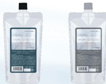
デラシオ コスメカクテル スタイルQ ベーシッククリーム デラシオ コスメカクテル スタイルQ マイルドクリーム