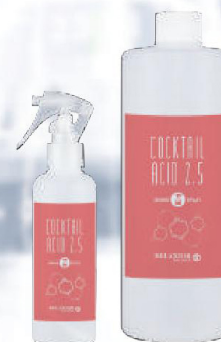
デラクシオ カクテルアシッド 2.5

pH2.5の2層構造でサロンワークやホームケアでのご使用において、輝き・潤い・弾力を実感できるプロフェッショナル用処理剤。スタイルQの施術に最適なアイテム。