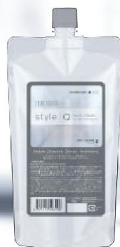
デラクシオ コスメカクテル スタイルQ マイルドクリーム

ハイダメージ毛に最適な、毛髪への優しさを追求した中性域のシステアミン系カーリングクリーム。