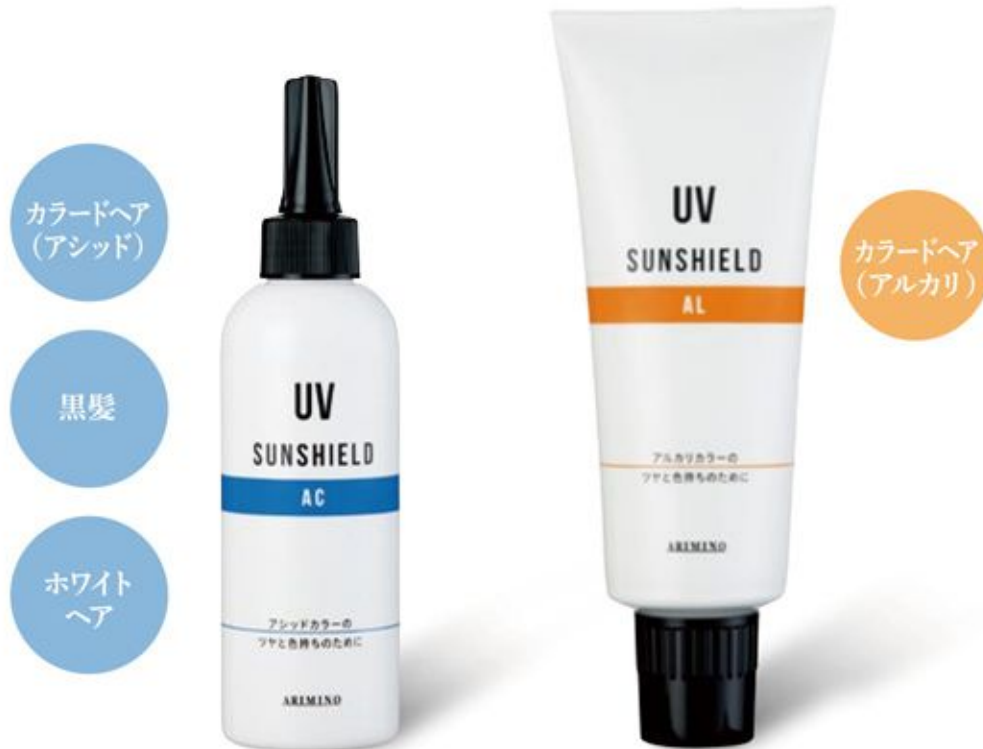
ヘアカラー サンシールドAC ふわっと弾力のある仕上がり ＜ヘアトリートメント＞ 200mL

髪ダメージの大きな原因の1つは活性酸素。活性酸素は褪色、変色、色あせや黄ばみなどの悪影響をもたらします。「ヘアカラー サンシールド」は髪にツヤを与えながら、活性酸素を誘発するUVダメージをプロテクトし、美しい髪色を守ります。