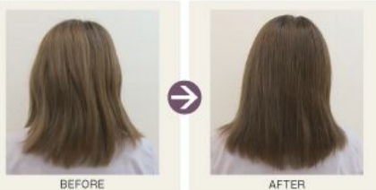
東京カラーパレット(黒系:藍系=2:1) : ガルバCMCケアシャンプー = 2:1