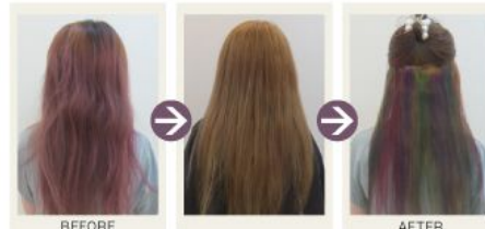
(全体のベース)東京カラーパレット(黒系) : DETRA = 2:1 (ワンポイント)東京カラーパレット(各色) : DETRA = 2:1