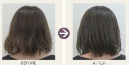
東京カラーパレット(藍系) : ガルバCMCケアトリートメント = 2:1