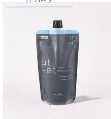
ウトエト ストレート H 第1剤 ＜チオグリコール酸塩＞