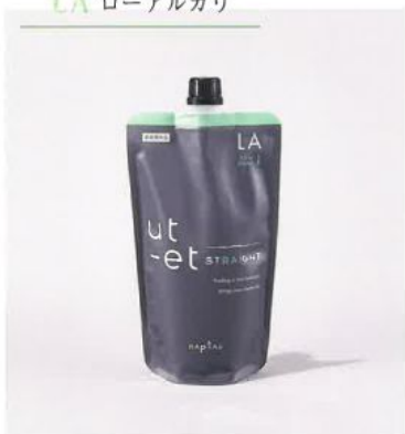
ウトエト ストレート LA 第1剤 ＜チオグリコール酸塩＞