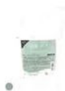
ネット マルチリペアローション