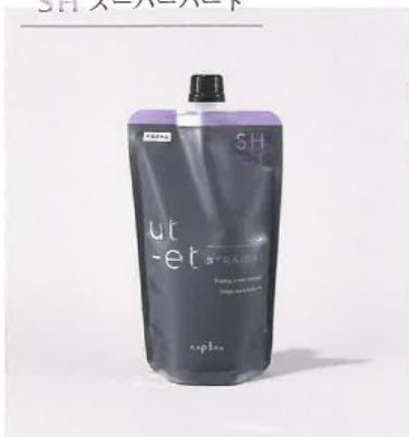
ウトエト ストレート SH 第1剤 ＜チオグリコール酸塩＞