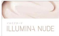
イルミナヌード ILLUMINA NUDE