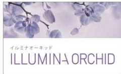
イルミナオーキッド ILLUMINA ORCHID

未体験の「光色」で、新しいあなたに出会いましょう。あなたはどの「光色」を選びますか？