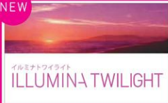
イルミナトワイライト ILLUMINA TWILIGHT