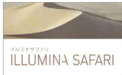
イルミナサファリ ILLUMINA SAFARI