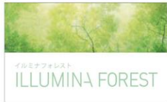
イルミナフォレスト ILLUMINA FOREST