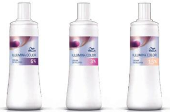
イルミナクリーム ディベロッパ 6% イルミナクリーム ディベロッパ 3% イルミナクリーム ディベロッパ 1.5%

「イルミナカラー」専用の酸化剤 仕上がりがイメージにあわせて最適な濃度をチョイス クリームタイプの酸化剤。 通常は6%、暗めの仕上がりがマイルドさを求める場合は3% または1.5%をご使用ください。