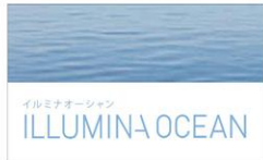
イルミナオーシャン ILLUMINA OCEAN