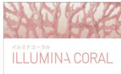
イルミナコーラル ILLUMINA CORAL